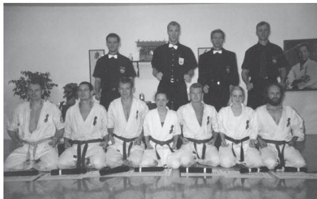
Nye 1 Dan - 1999