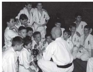
De stolte vindere